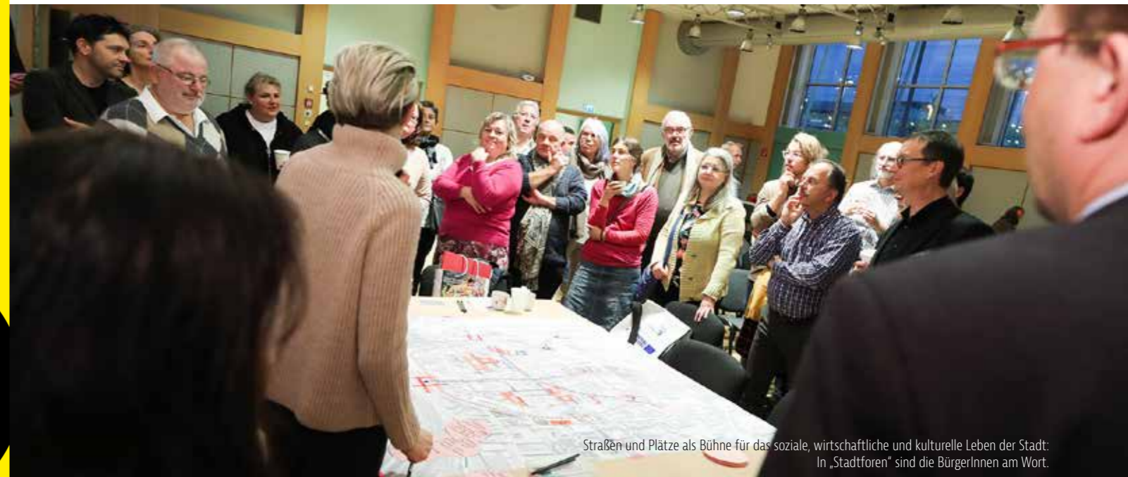
Straßen und Plätze als Bühne für das soziale, wirtschaftliche und kulturelle Leben der Stadt: In „Stadtforen“ sind die BürgerInnen am Wort.

Mit diesem Ziel startet der Arbeitskreis nun einen Planungsprozess. Der Dialog bindet Verwaltung und Politik ein, VertreterInnen der Wirtschaft und neben weiteren Akteuren die gesamte Öffentlichkeit. Im Ergebnis wird eine Leitkonzeption zur Entwicklung der öffentlichen Räume in der St. Pöltener Innenstadt stehen.