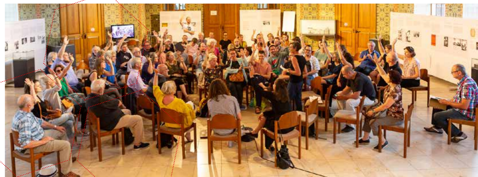
Die öffentlichen Diskussionen des Vereins Kulturhauptstart liefern ein Abbild der lebendigen Zivilgesellschaft in St.Pölten.

Kontakt: kulturhauptstart-stp.eu hallo@kulturhauptstart-stp.eu